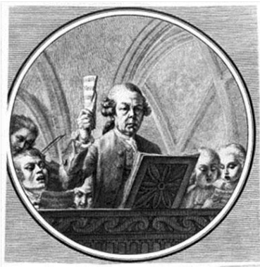
Franz Xaver Richter

Die Barockkultur des 18. Jahrhunderts zu schätzen, dafür gibt es zahlreiche ästhetische und ideelle Gründe. Zu letzteren gehört einerseits der Umstand, dass man noch keinen Nationalismus im neuzeitlichen Sinne kannte. Die adelige Hochkultur am Vorabend der Französischen Revolution war international ausgerichtet. Andererseits gab es noch kein Auseinanderfallen von profaner und kirchlicher Lebenswelt. Feierliche Anlässe des Staates waren eingerahmt von kirchlichen Feiern, von feierlichen Pontifikalämtern, Prozessionen und öffentlichem Gebet vor Bildstöcken auf den Straßen und Plätzen von Städten und Dörfern. In Folge dessen war auch das musikalische Wirken von Komponisten an Bischofshöfen, die daneben auch Sitz einer Landesregierung waren, nicht nur auf die Schaffung von Kirchenmusik ausgerichtet. Neben Messkompositionen findet man ebenso Sinfonien, Konzerte und Kammermusik für Unterhaltungs- und Repräsentationsanlässe im musikalischen Repertoire. Stilistisch lassen sich die früheren Werke von Richter und Zach noch dem Barock zuordnen. In den späteren Kompositionen kommt, wie bei Johann Georg Lang durchgängig spürbar, die Vorklassik zum Tragen. Darüber hinaus glaubt man vor allem bei Zach und Lang, melodische Elemente der böhmischen Volksmusik zu hören.