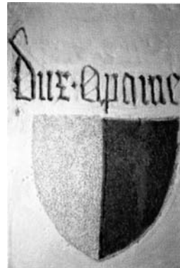
Im Wappensaal des Wenzelschlosses in Lauf sehen wir als Schluss-Stein den böhmischen Löwen, und im Wappenfries die Wappen des Markgrafentums Mähren, der Herzöge von Schlesien und Oppeln und des Herzogs von Scweidnitz und Troppau.