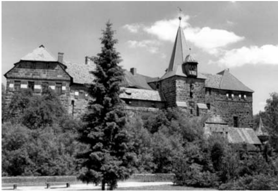
Das Wenzelschloss in Lauf

hielt, war er bemüht, Gebiete zwischen Nürnberg und Böhmen zu erwerben, um eine Landverbindung von Nürnberg zu seinem Königreich Böhmen zu schaffen. Dabei war ihm von Vorteil, dass seine zweite Frau (nach dem Tode von Bianca von Valois) Anna von der Pfalz war und bei der Heirat als Morgengabe große Gebiete der heutigen