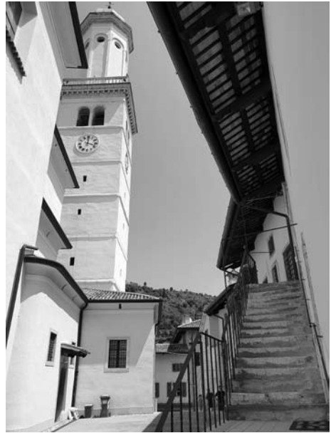
Dom des hl. Adalberts in Cormòns