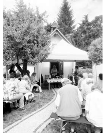
Die Josefskapelle in Niederoderwitz.